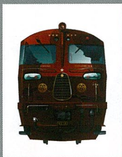
ななつ星 in 九州

著書として『はくは「つばめ」のデザイナー』、『旅するデザイン』、『水 戸岡鋭治の「正しい」鉄道デザイン』、『電車のデザイン』、『あと 1% だけやってみよう』、『電車をデザインする仕事』、『ななつ星 in 九州 画集』、『鉄道デザインの心』などがある。