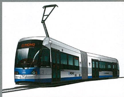
超低床式路面電車 MOMO