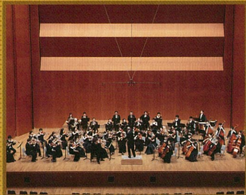
管弦楽 岡山フィルハーモニック管弦楽団