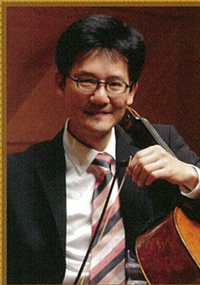
チェロ ウェン=シン・ヤン