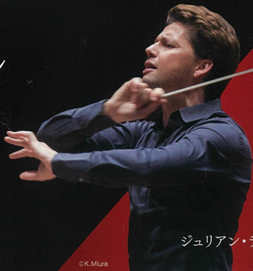
ジュリアン・ラクリン (指揮)