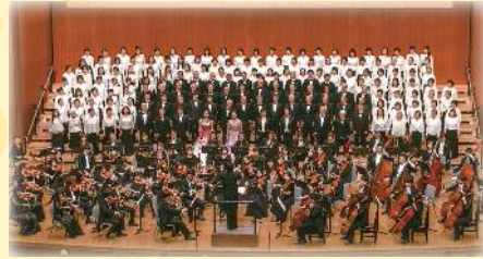
ベートーヴェン「第九」演奏会 2019年12月1日公演