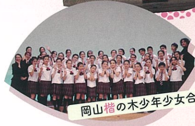
岡山楷の木少年少女合唱団