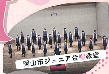
岡山市ジュニア合唱教室