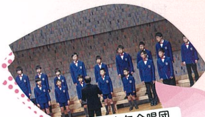
桃太郎少年合唱団